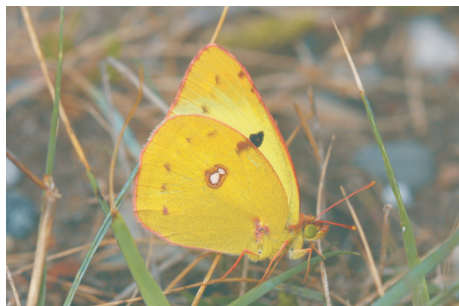
Goldene Acht: Schmetterling des Jahres 2017