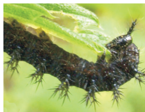
Landkärtchenraupe, erkennbar am typischen Dornen auf dem Kopf

Unser Garten muss für Schmetterlinge in zweifacher Hinsicht Lebensraum sein. Einerseits für den erwachsenen Schmetterling, der genügend geeignete Nektarpflanzen findet, andererseits auch für die Raupe mit geeigneten Futterpflanzen in „angemessener Wuchsumgebung“.