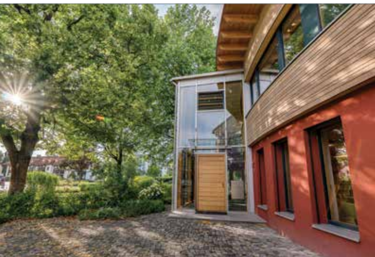
Das neue IBN-Bürogebäude ist sowohl Arbeitsplatz als auch Beispielobjekt, wie heutige Anforderungen an baubiologisches, gesundes und nachhaltiges Bauen umgesetzt werden können

Ein wichtiges Anliegen des IBN sei, so Schneider, „über baubiologische Aspekte unabhängig, neutral und fachkundig zu informieren“, was aber nur mit gut ausgebildeten Fachleuten möglich sei. Damit fällt nun der Blick auf die zweite Adresse, die die anfängliche Recherche ergab – nämlich den „Verband Baubiologie“ (VB). Wie das IBN beruft er sich auch auf die „25 Grundregeln des baubiologischen Bauens“ und hat das Ziel, „Fachkompetenz und Erfahrung“ im Beruf an jüngere Kollegen im Austausch weiterzugeben, wie Vorstandsmitglied Joachim Gertenbach erklärt. Inzwischen hat