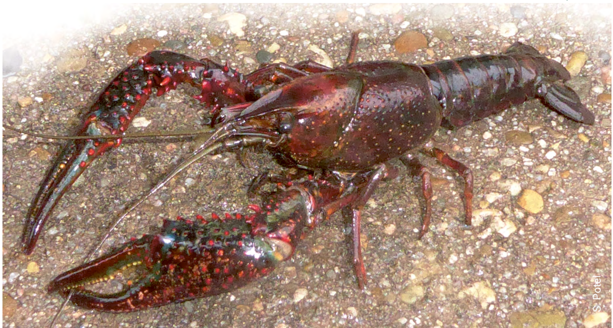
Roter Amerikanischer Sumpfkrebs

Die heimischen Flusskrebse, insbesondere der Steinkrebs als FFH-Anhang-II-Art, unterliegen dem Naturschutzrecht, und unter dem Gefahrenpotenzial der Krebspest kann man auch nicht beliebig durch die Landschaft ziehen, um die Tiere zu suchen. Zu leicht wird man beim Wechsel von einem Gewässer zum nächsten selber als „Spreader“ der Krebspest zum Gefahrenpotenzial. In der Monitoring-Szene „unkt“ man, dass so manches Vorkommen heimischer Flusskrebse durch Unkenntnis der Vorkommen versehentlich zugrunde gerichtet wurde – also durchaus eine Tatsache, die zur extremen Vorsicht anhält. Die nächste Rechtsangelegenheit ist die Tatsache, dass die Flusskrebse unter das Fischereirecht fallen, und somit für jeden, der sich bewusst mit dem Thema im Gelände befasst, die Verpflichtung zur rechtlichen Absicherung besteht.