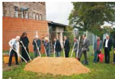
Spatenstich am Kloster Blieskastel.

Der Wintringer Hof selbst bietet für dieses Projekt die perfekte Kulisse. Neben einem herausragenden kulturhistorischen Ort am alten Hofensemble ist oberhalb ein modellhafter Biolandbetrieb entstanden, der behinderten Menschen eine gesellschaftliche Integration