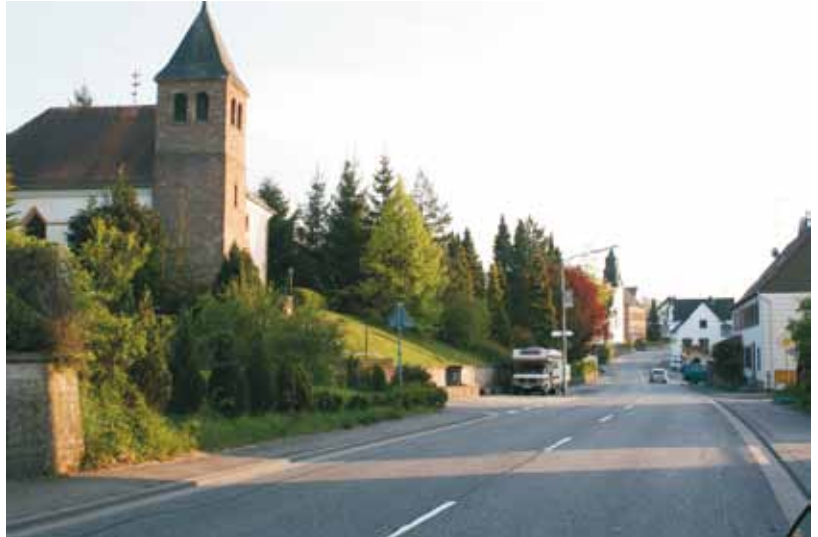
Unser Dorf - Fit für die Zukunft. Die Ortsdurchfahrt von Bliesdalheim.

Das Projekt ist im Juni 2011 gestartet. Projektträger ist die Gemeinde Gersheim. Die Laufzeit beträgt zwei Jahre. Ziel des Projektes ist es, in Bliesdalheim, einem Ortsteil der Gemeinde Gersheim, Modelle für die energeti-