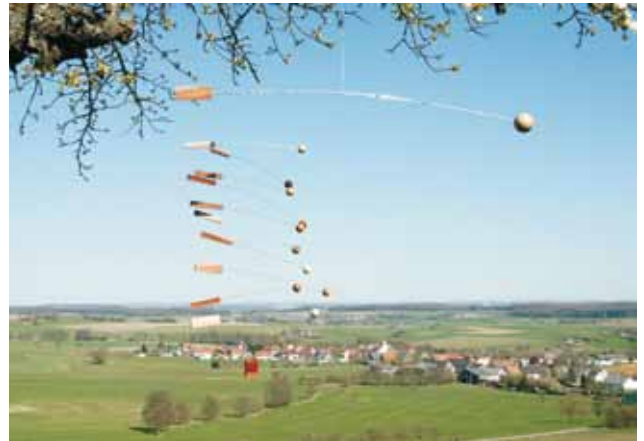
Darstellung des MOBILES mit seinen 10 Handlungsfeldern