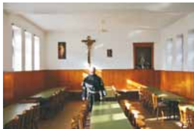
Die historische Pilgerrast im Kloster Blieskastel vor dem Umbau.

Projekträger soll die Gemeinde Kleinblittersdorf sein. Diese möchte den so genannten Mittelbau der historischen Hofanlage zu einer Pilgerrast in Kooperation mit der Lebenshilfe Obere Saar umbauen. Das Projekt ist derzeit in der Projektierungsphase und soll ab 2011 in ca. zwei Jahren abgeschlossen sein. Ziele des Projektes sind neben dem modellhaften Erhalt und der Wiederherstellung kulturellen Erbes am Wintringer Hof das Schaffen von Übernachtungskapazitäten für Pilger, die Vermarktung regionaler und ökologisch erzeugter Produkte sowie eine konsequente Erweiterung des sozialen Auftrags der Lebenshilfe.