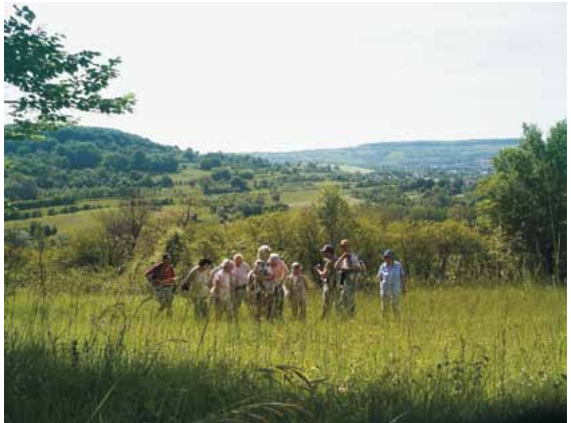
Grenzüberschreitende Wanderung im Naturschutzgebiet zwischen Niedergailbach und Obergailbach.

Projektträger ist der Biosphärenzweckverband Bliesgau. Das Projekt wurde ursprünglich im Ökologischen Schullandheim Gersheim „Spohns Haus“ entwickelt und befindet sich gerade in der Startphase. Die Laufzeit beträgt drei Jahre. Ziel des Projektes ist die touristische Vermarktung umweltpädagogischer Angebote der Region im