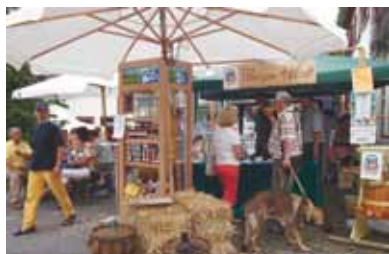
Vermarktung regionale Produkte aus dem Bliesgau über das Bliesgau-Regal.

Regionalvermarktung ist grundsätzlich keine „Öko-Bewegung“. Leider wird dies oft in einen Topf geworfen. Regionalvermarktung ist vielmehr eine logische Reaktion auf die Globalisierung und Anonymisierung der Märkte. Die Verbraucher werden wieder kritischer, legen Wert auf Transparenz und Qualität. Gleichzeitig werden die regionalen Marktstrukturen gestärkt und Arbeitsplätze und Wertschöpfung in der eigenen Region erhalten. Heimat und Familie und Arbeiten passen eben nur zusammen, wenn Infrastruktur und Arbeitsplätze in der eigenen Region erhalten oder neu geschaffen werden. Dass durch Regionalver-