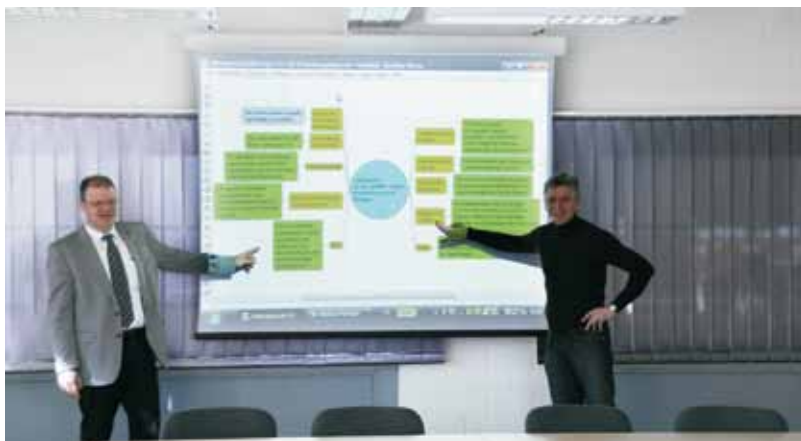
Die LAG in der Beratung - Das MOBILE für das Projekt am Wintringer Hof wird erstellt.

Das Projekt steht in unmittelbarem Zusammenhang mit dem Projekt „Pilgerrast und Pilgerherberge Kloster Blieskastel“. Auch hier werden mit LEADER-Mitteln an einem sehr prominenten Ort in Blieskastel Kapazitäten für Pilger und Wanderer geschaffen. Das Projekt wird 2012 abgeschlossen sein.